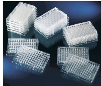
Thermo Scientific™ Nunc Immunoplate Maxisorp

Thermo Scientific™ Multiskan Sky™ adalah microplate reader UV-Vis dengan teknologi monokromator untuk kebutuhan pengukuran fotometri seperti ELISA. Hasil pengukuran dapat dibaca dengan cepat dan akurat dalam kurun waktu 6 detik . Didukung oleh Software SkanIt™ yang intuitif, memungkinkan pengguna untuk membuat protokol pengerjaan secara sistematis, melakukan analisis hasil pembacaan, mendapatkan kurva kalibrasi, serta konsentrasi sampel yang diuji .