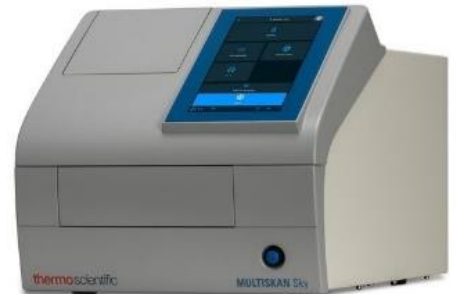
Thermo Scientific™ Multiskan Sky™

Thermo Scientific™ Multiskan Sky™ Menggunakan layar sentuh dan dapat terkoneksi dengan komputer menggunakan Software SkanIt™